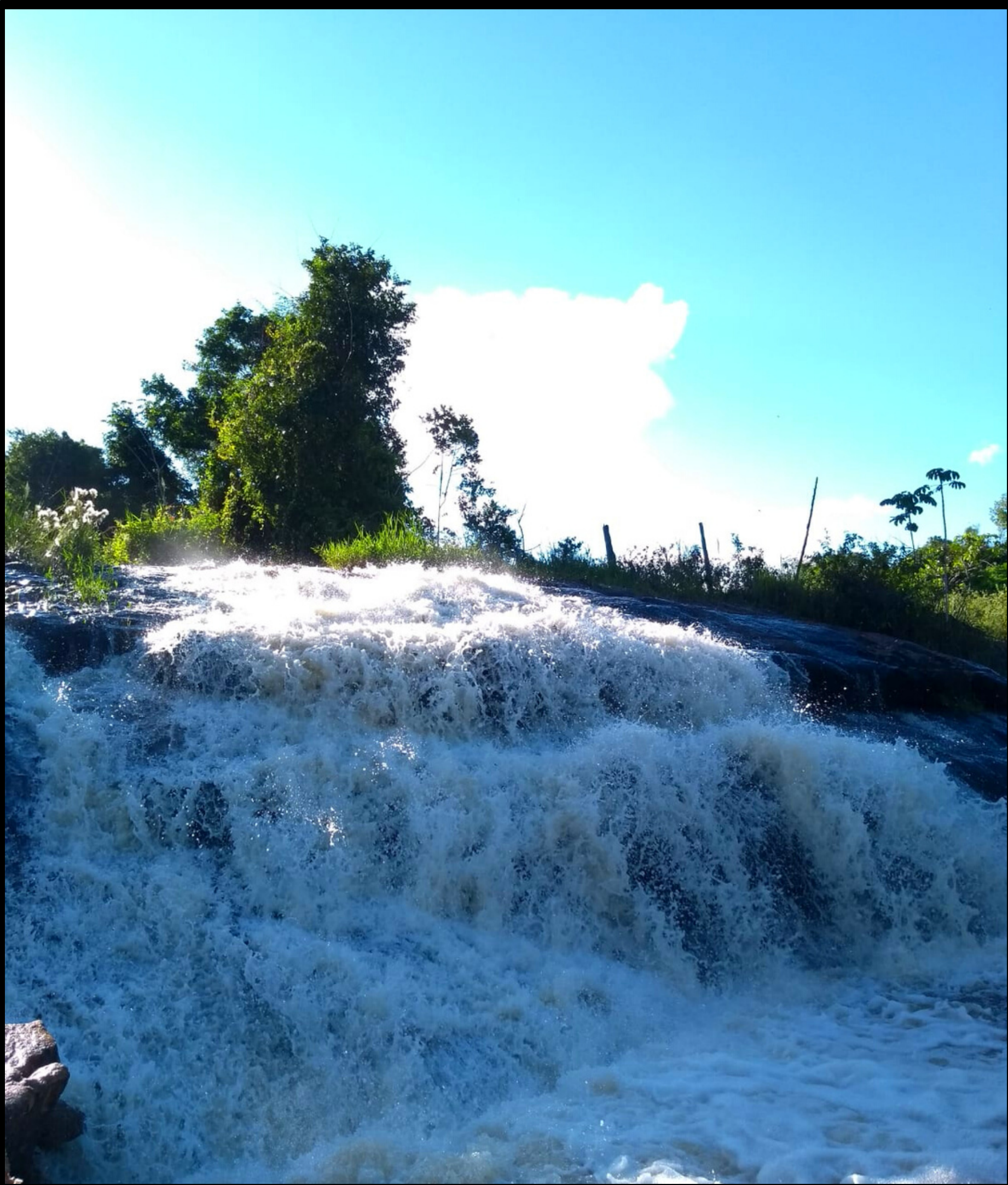
CACHOEIRA VALFRIDE - CÓRREGO DAS TRAÍRAS