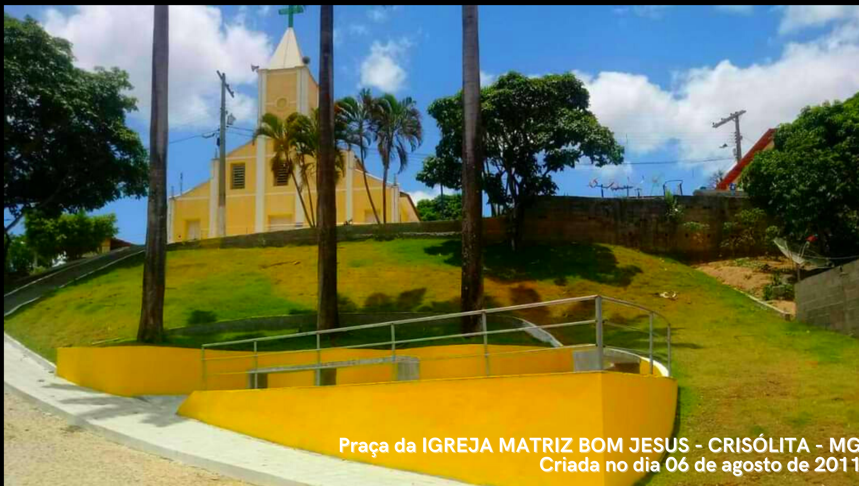
Praça da IGREJA MATRIZ BOM JESUS - CRISÓLITA - MG Criada no dia 06 de agosto de 2011